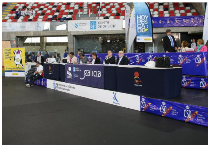
MESA DE CONTROL

CAMPEONATOS DE ESPAÑA EN EDAD ESCOLAR DIRECCIÓN GENERAL DE DEPORTES Subdirección General de Promoción Deportiva y Deporte Paralímpico