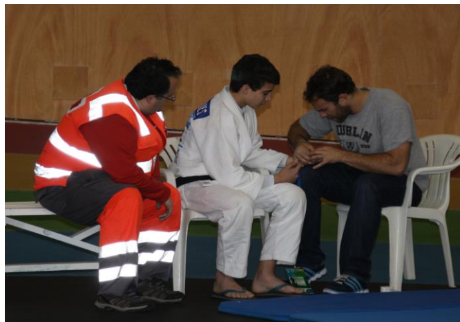
SERVICIOS MÉDICOS - FISIOS