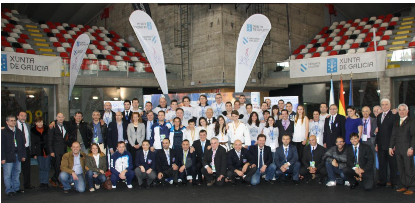
ORGANIZACIÓN Y VOLUNTARIOS