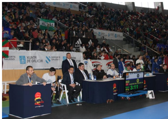
MESAS DE CRONOS